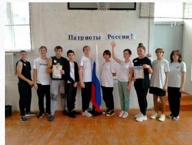
Спартакиада школьников Ростовской области